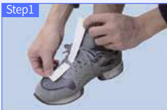
신발에 칩을 착용 후 칩의 양끝부분을 둥글게 말아주세요.