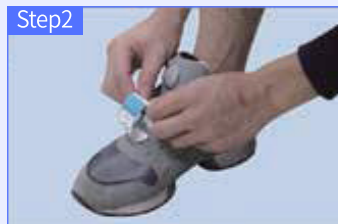
테이프 접착면에 반대편 스티커부분을 붙이세요.