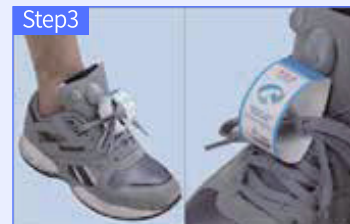
위 사진과 같이 정착하면 완료입니다.